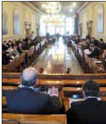
CA' FARSETTI Il Consiglio comunale

Nella tabella qui a fianco i contributi assegnati ai vari gruppi per il 2012 e i soldi effettivamente spesi nel corso dell'anno