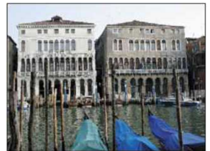
CA' FARSETTI Sopra, il Comune. A destra, la Giunta